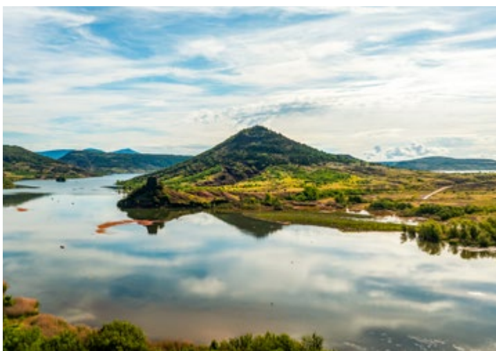
LAC DU SALAGOU

Le Grand Site Salagou - Cirque de Mourèze se distingue par une richesse géologique exceptionnelle, marquée par la ruffe rouge caractéristique de la région, qui lui confère une identité unique. En quelques kilomètres, les paysages révèlent une remarquable diversité, allant des roches volcaniques aux reliefs calcaires dolomitiques du cirque de Mourèze, offrant un voyage à travers les grandes ères géologiques.