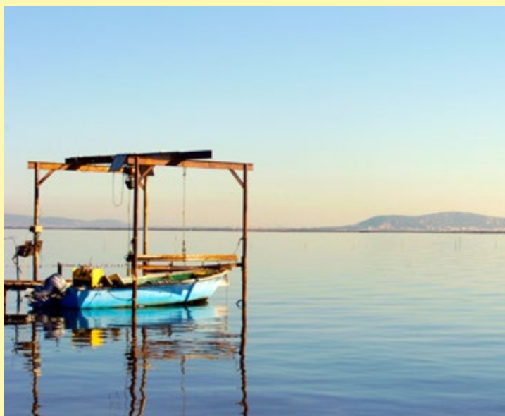
ETANG DE THAU

Les Espaces Naturels Sensibles (ENS) constituent le socle de la préservation des paysages, de la biodiversité et des ressources naturelles de l'Hérault. Engagé dès les années 1980 dans une démarche pionnière, le Département œuvre à protéger ces espaces tout en les rendant accessibles, afin de concilier découverte, sensibilisation et respect des milieux. Lieux d'équilibre, les ENS permettent à la fois de préserver des écosystèmes fragiles, de soutenir des activités traditionnelles comme le pastoralisme et de prévenir les risques naturels. À travers des aménagements comme la Passa Meridia ou Passa Païs, ils offrent des espaces d'évasion durable, où nature et usages cohabitent harmonieusement.