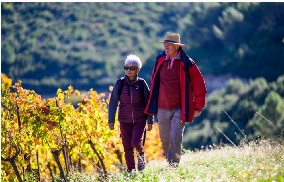
Balade dans les vignes de Minerve

« ENTRE GORGES PROFONDES ET RUELLES MÉDIÉVALES, CHAQUE PAS RACONTE UNE HISTOIRE VIEILLE DE MILLE ANS. »