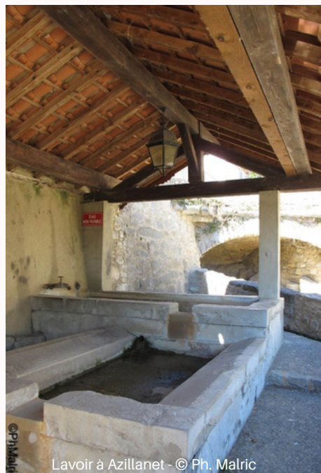
Lavoir à Azillanet

Arrivée ensuite à La Caunette qui se déploie en ruban étroit entre la falaise et la Cesse, avec des maisons médiévales serrées, des passages couverts, et surtout... La Carambelle, son ancien "faubourg fortifié" unique en son genre. Un circuit paysager "entre gorges et causses", ouvert en avril 2026, permet de découvrir le terroir spécifique de La Caunette et le cœur de village.