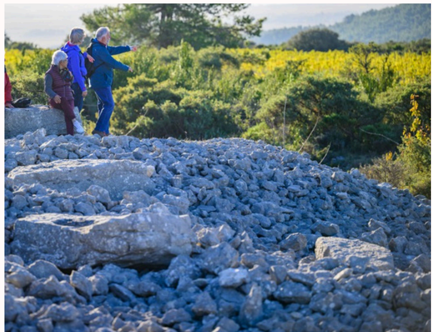
Le site des Meulières

Aujourd'hui, on peut voir un moulage de quelques-unes de ces traces dans le musée archéologique de Minerve.