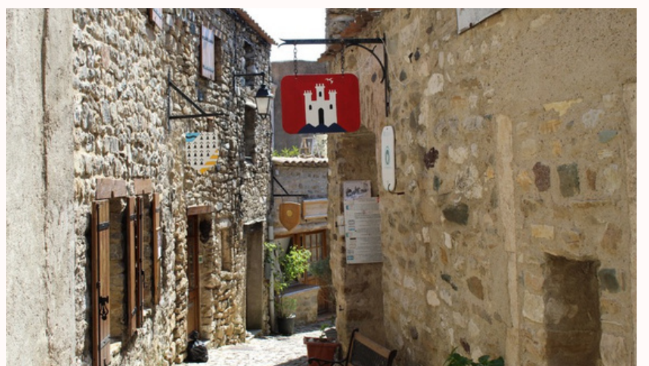
La rue des Martyrs à Minerve

Ces lieux rendent l'expérience du visiteur immersive et mémorable. Minerve porte une densité historique exceptionnelle : oppidum wisigothique, cité cathare martyrisée, place forte royale, puis village pastoral et viticole.