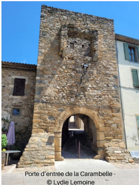
Porte d'entrée de la Carambelle

Arrivée ensuite à La Caunette qui se déploie en ruban étroit entre la falaise et la Cesse, avec des maisons médiévales serrées, des passages couverts, et surtout... La Carambelle, son ancien "faubourg fortifié" unique en son genre. Un circuit paysager "entre gorges et causses", ouvert en avril 2026, permet de découvrir le terroir spécifique de La Caunette et le cœur de village.