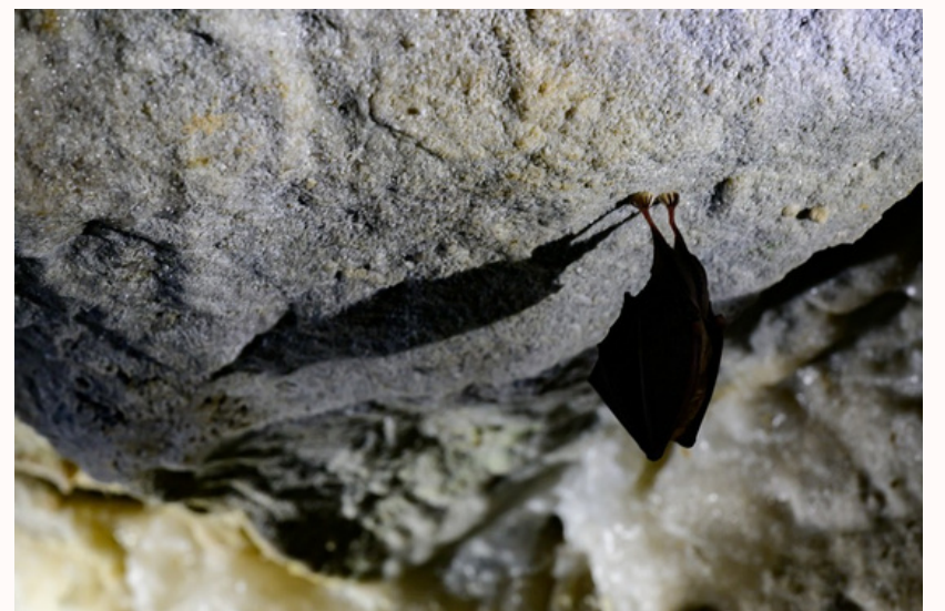
Minioptère dans la grotte de la fileuse de verre à Courniou

Au-dessus des falaises, les plateaux de Cesseras, Siran ou Azillanet accueillent des habitats secs d'une grande richesse floristique, avec des orchidées méditerranéennes, des cistes ou encore des pelouses à thym et lavande sauvage.