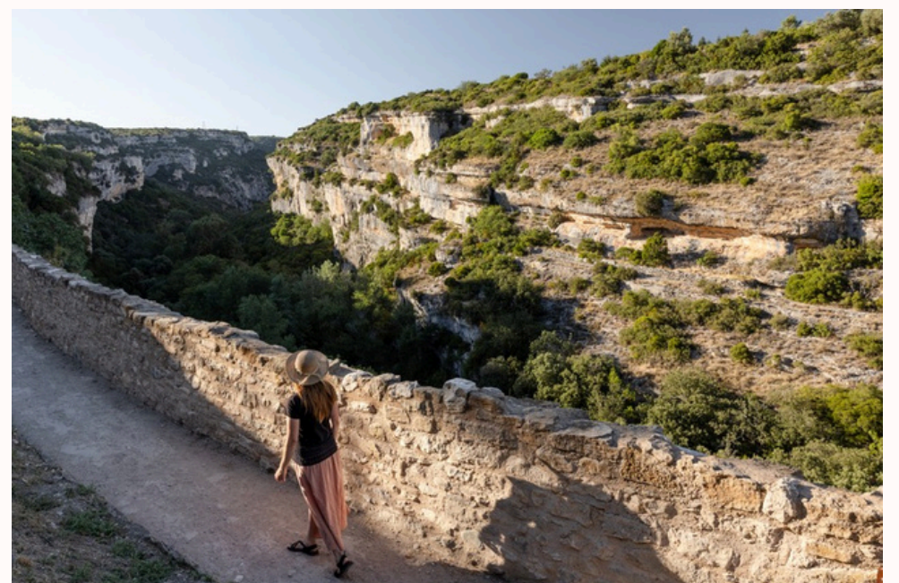
Les remparts restaurés, à Minerve