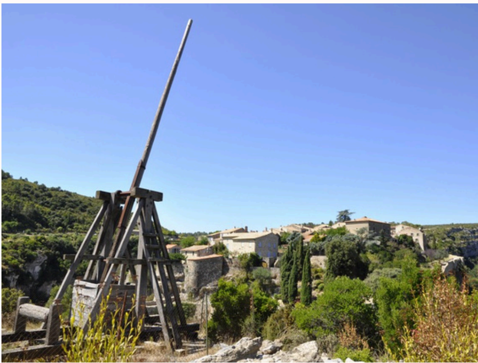
La "Malvoisine", réplique du trébuchet

Aujourd'hui encore, la silhouette du village a conservé son caractère médiéval : ruelles pavées, maisons en pierre claire, vestiges de remparts, traces d'anciens ouvrages militaires... Le visiteur chemine dans un décor authentique, intact et immersif. Le Musée d'Archéologie et d'Histoire permet de mieux comprendre l'évolution du site, de la préhistoire à l'époque moderne, grâce à des collections locales remarquablement présentées.