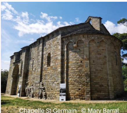
Chapelle St-Germain

l'architecture traditionnelle du Minervois. Le village est un beau point de départ vers les gorges de la Cesse et les sentiers panoramiques, un village-sentinelle où commence le spectaculaire. La chapelle Saint-Germain est aussi un incontournable de la visite.