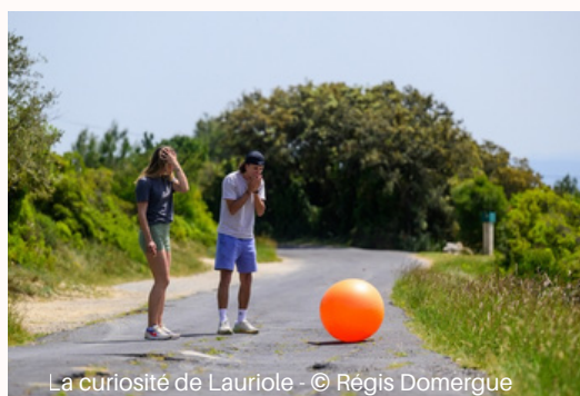
La curiosité de Lauriole

En route pour Cesseras qui s'étend entre vignobles et gorges. Le village en lui-même, avec son église et ses rues en lignes brisées, est une belle introduction à