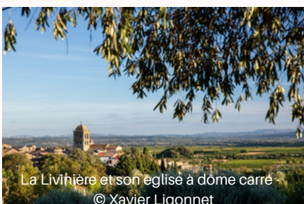
La Livinière et son église à dôme carré

les voitures donnent l'impression de remonter la colline alors qu'elles descendent réellement. Une illusion d'optique fascinante qui attire l'œil et les visiteurs.