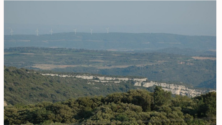
Panorama depuis Vélieux

Afin de bien saisir les transitions paysagères que forment le Site, nous vous proposons de démarrer votre visite à près de 500 m d'altitude, par le village de Vélieux qui domine le Grand Site. Il en offre l'une des vues les plus vastes. Ici, le patrimoine est indissociable du relief : pastoralisme, petits sanctuaires, traces anciennes dans les drailles et clapas. A découvrir grâce au sentier "Sur les traces des Romains".