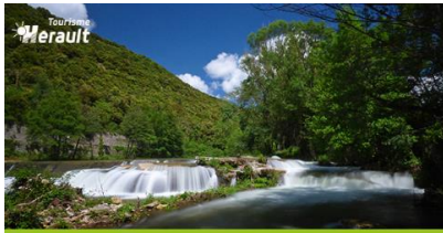
LE GRAND ORB - Avène - Bédarieux - Lamalou les Bains

Les résultats de cette news adressées au fichier bassin de vie sont très bons : le taux d'ouverture cumulé dépasse 76% (soit près de 22 300 consultations), le taux de réactivité est satisfaisant (13,2%), près de 2 950 clics générés sur l'ensemble des contenus. A noter les très belles performances de l'édito (383 clics), de l'offre dédiée au restaurant (361 clics) et le jeu bassin de vie (260 clics).