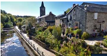
Le Canal du Midi

344 Séjours randos dans le Haut Languedoc