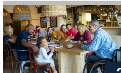
Les plus beaux spots de baignade