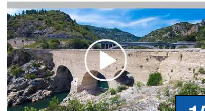
Les tops d'un séjour réussi à Montpellier

159 A vous les vacances et les Grands Sites