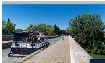
Votre Logis, votre été

Avec les Logis de l'Hérault, retrouvez les plaisirs d'un été inoubliable ! L'accueil commence dès les vacances. Et la table ! elle raconte nos richesses du Languedoc. Rencontres gourmandes, balades enchantées, séjours familiaux, découvertes insolites, tout se conjugue avec bonheur entre la méditerranéenne, ses étangs, ses vignobles, les monts et les lacs... L'Hérault, fête, tout est à vous !