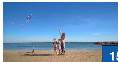
Les Grands Sites incontournables