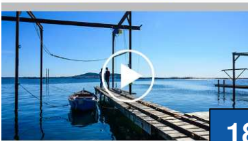
Top 5 des randos de l'été